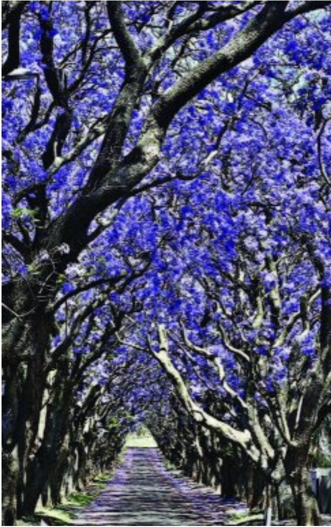
Die jakarandas van Cullinan se oudorp het weer vanjaar 'n pragtige vertoning gelewer. Laurika van d