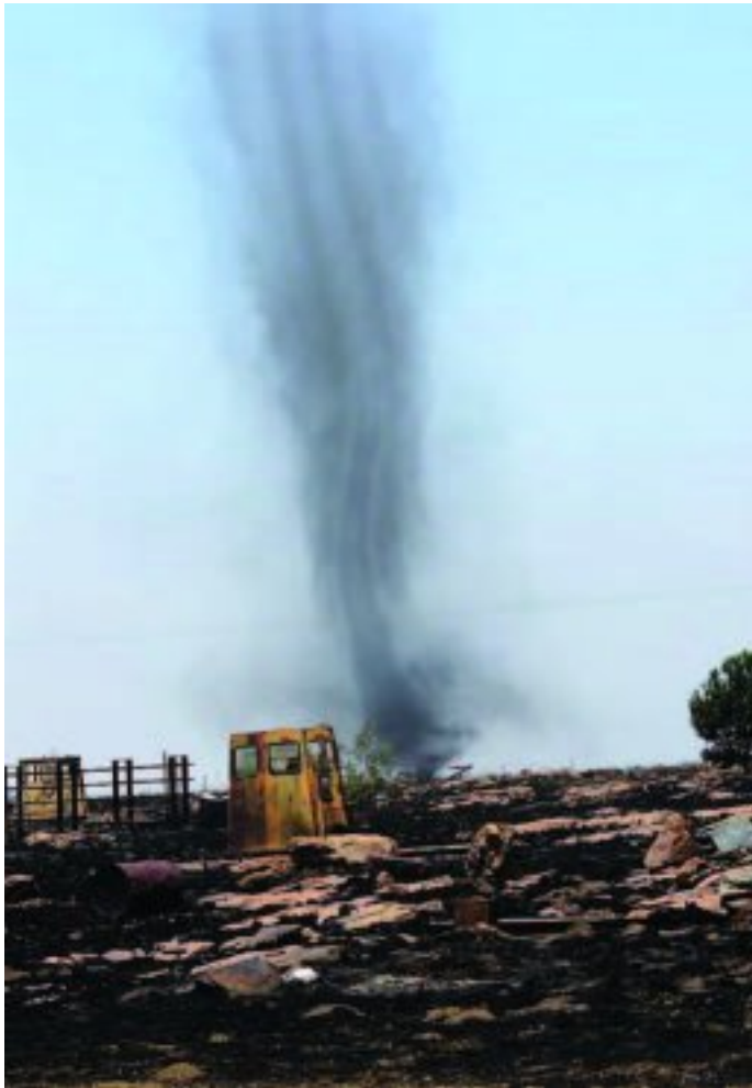
'n Dwarrelwind skop roet en as op in Kleinfontein se geweste na veldbrande verwoesting gesaai het