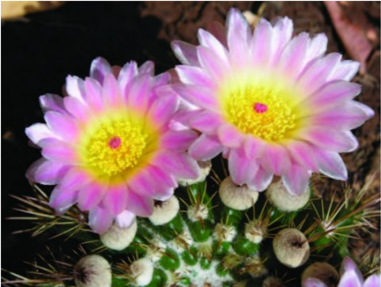
Carel Breytenbach wys hoe mooi dié kaktus in sy tuin op Kleinfontein blom