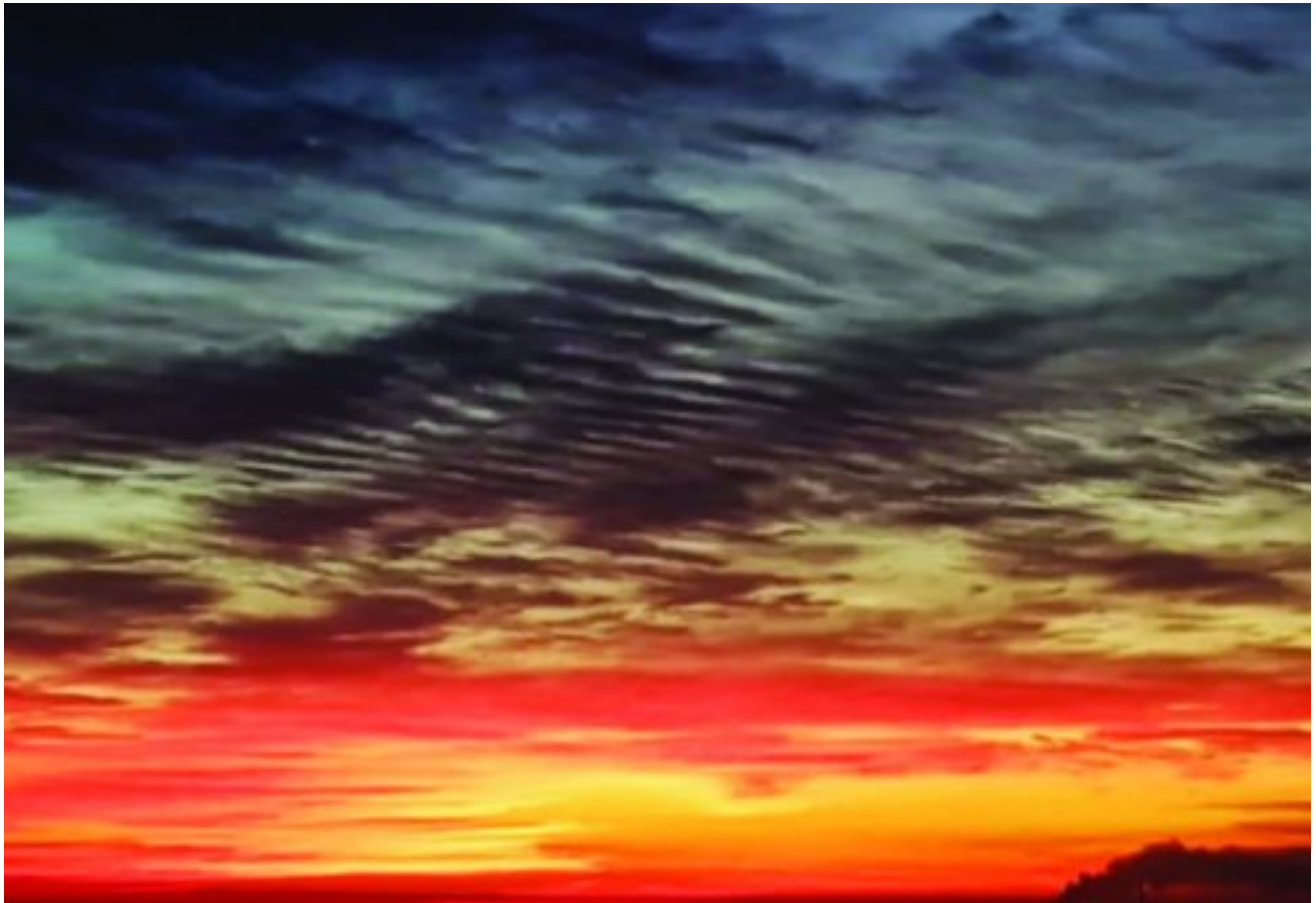
levers tussen Bapsfontein en Bronkhorstspruit met sonsopkoms