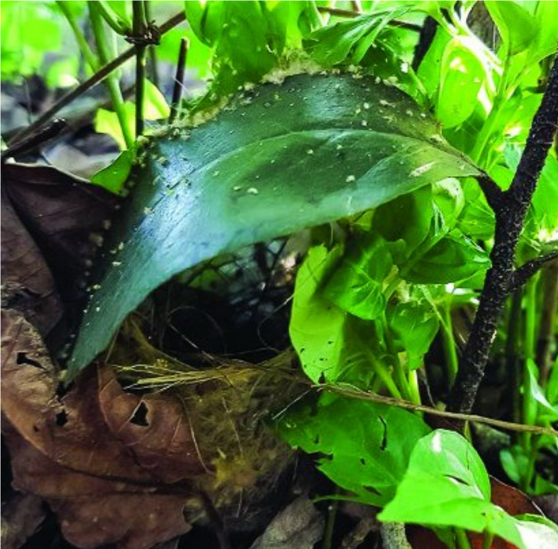
Die nessie onder blare wat met spinnekopdraad aan mekaar vasgewerk is

Die groenrug- en gysrugkwêkwêvoël klink soortgelyk, bou hulle nesses op dieselfde manier en di