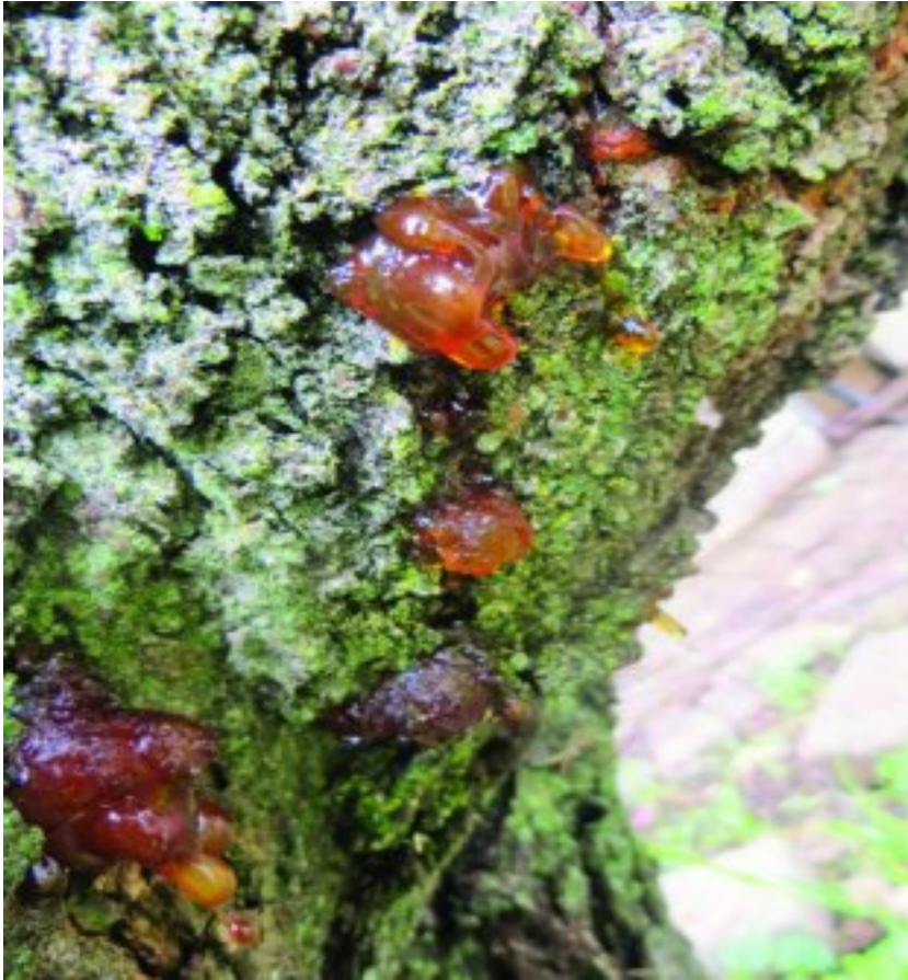
Gom en bas