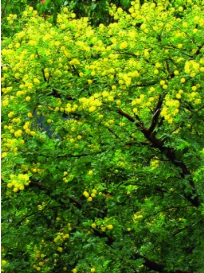
'n Soetdoring in blom

Ander sê die naam kom van die geur van sy blommetjies of van die soet gom, waaroor nagapies n