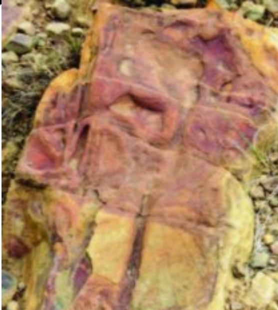
Foto: M. Die kled. Nat. die ewe aan die kante van die krake versterk. Die middelste deel van die rots