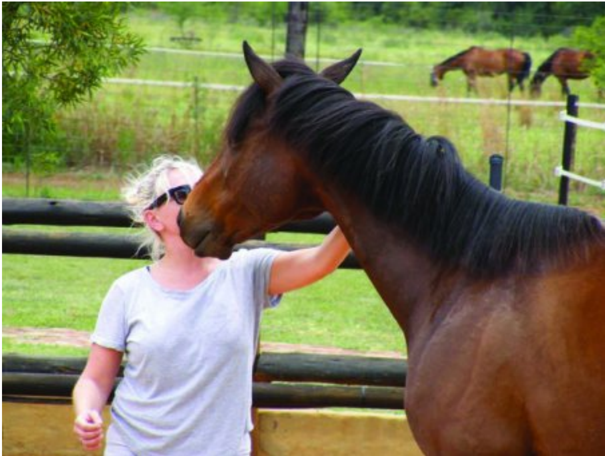
Net met die regte 'taal' kan jy die perd se vertrouwen