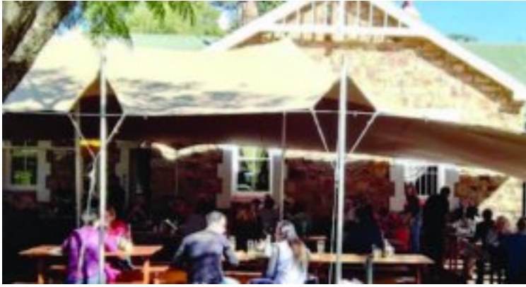
Kunstenaars wat by Cockpit Brewhouse in Cullinan optree, sluit in: 24 September – Jack Mantis