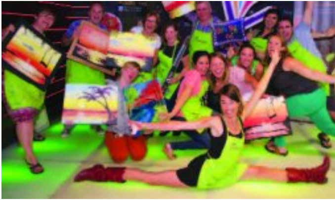
The next Paint Nite at The Collection is on 29 September from 7 to 10 pm. The cost is R550 per p