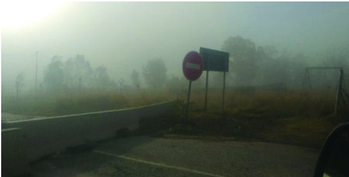
Dié foto is 5.30 nm op 28 Oktober in die rigting van die stasie geneem