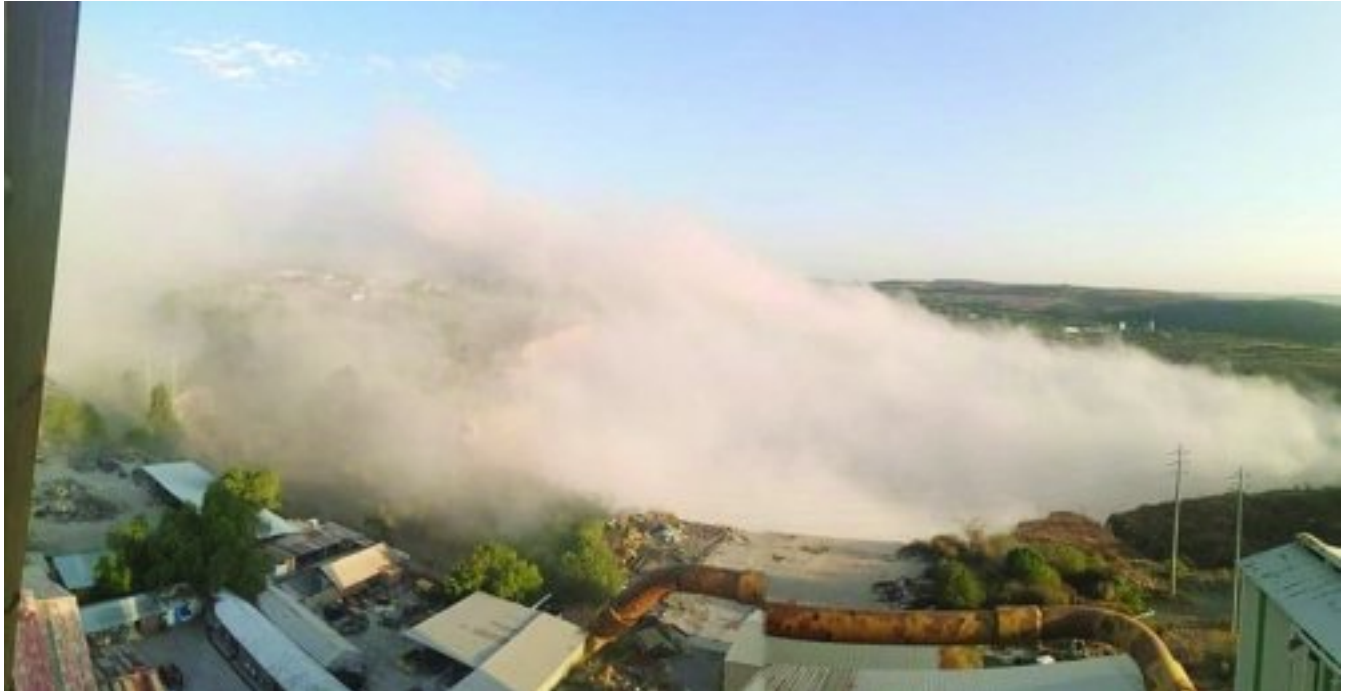
Die begin van die stofwolk in die oopgroef

Mynbou in die oop put op Cullinan is 50 jaar gelede reeds gestaak en alle mynboubedrywighede is