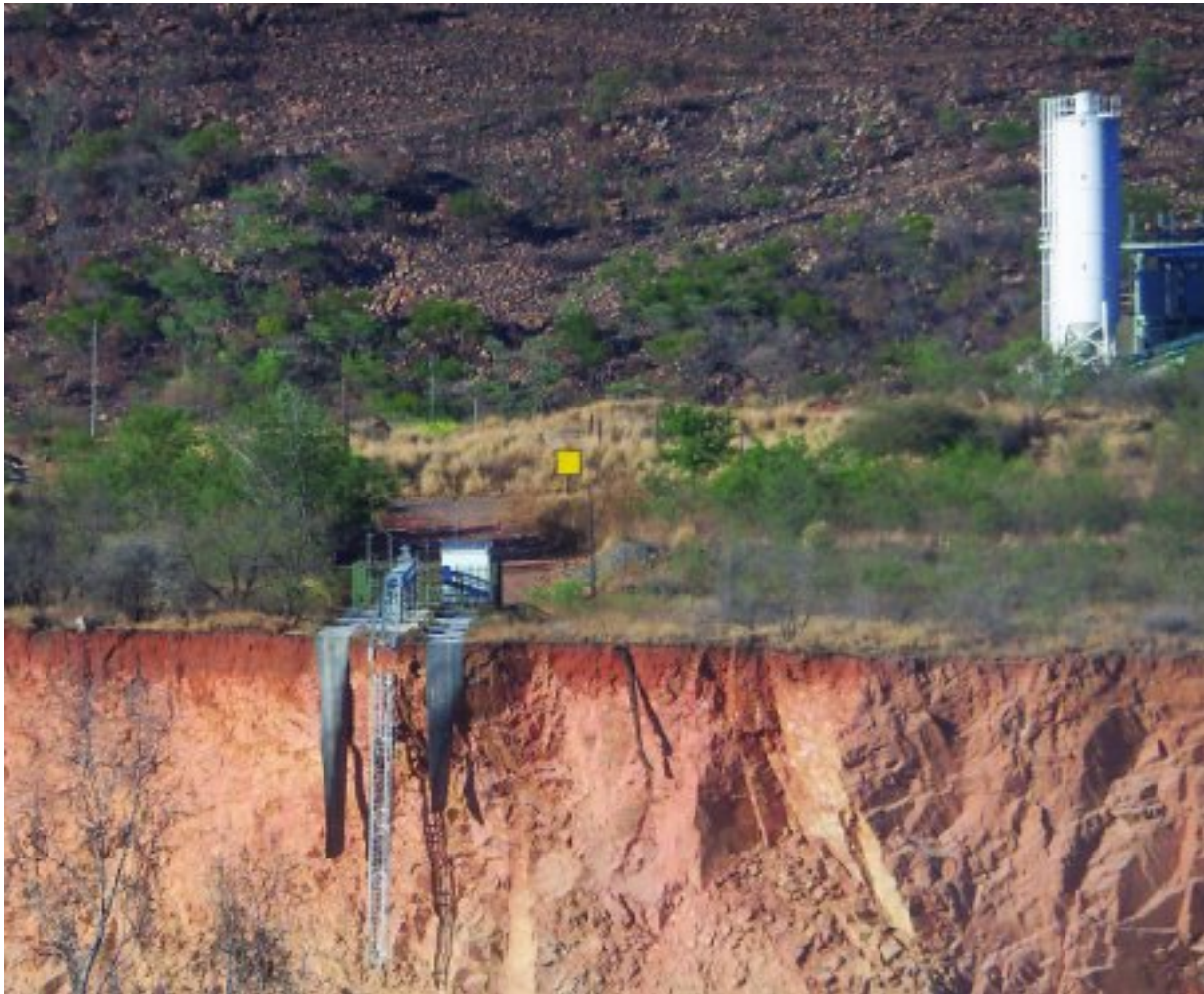
Die moniteringstelsel aan die suid-westekant van die oopgroef ná die wegkalwing