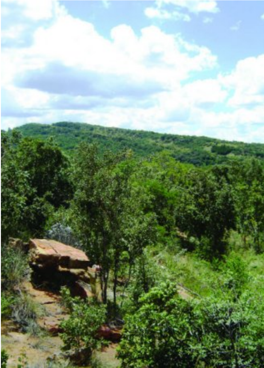
Eenkant toe se uitsig vanaf die stoep tafeltjie

Ek loop haal my koskeuse onder die spyskaarthofie wat 'Specialities' sê. Hier kry jy vier geregte w