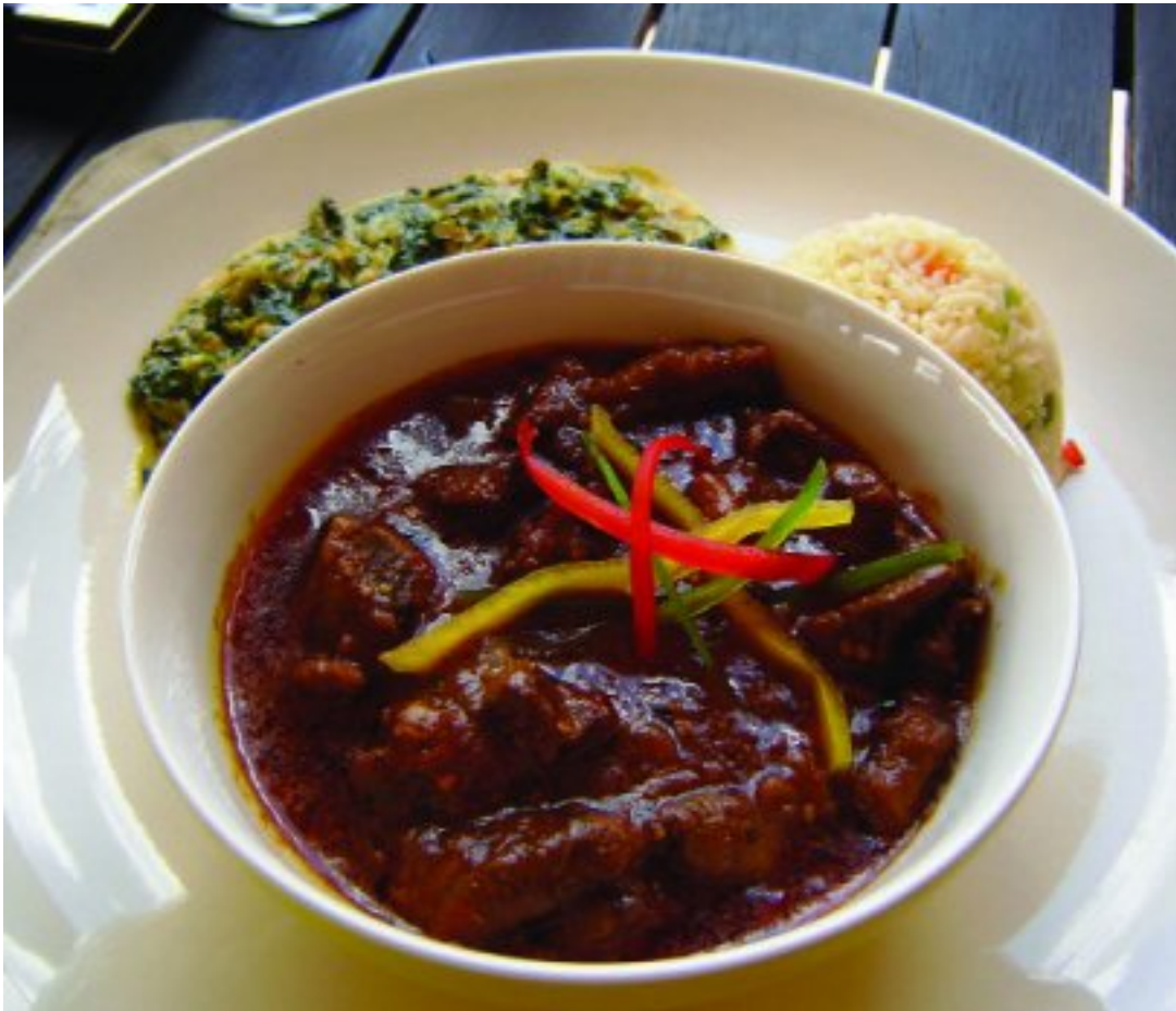
Lamskerrie met 'n Spaanse draai

Sy het aanvanklik op die eg Spaanse paella besluit, maar die sjef maak net dubbelporsies en ek is