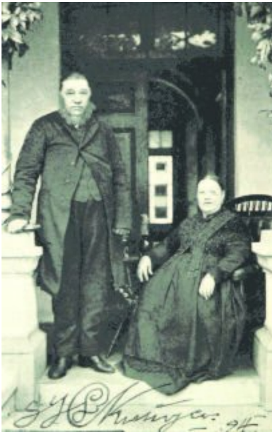
Paul Kruger en sy vrou, Gezina Susanna Fredrika Wilhelmina, op hulle huis se stoep