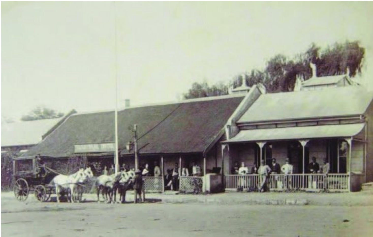
Polley's Transvaal Hotel in Pretoriusstraat in die 1890's

James het later vertel dat as dit nie vir die twee wagte by die voorhek was nie, jy sou dink dat een