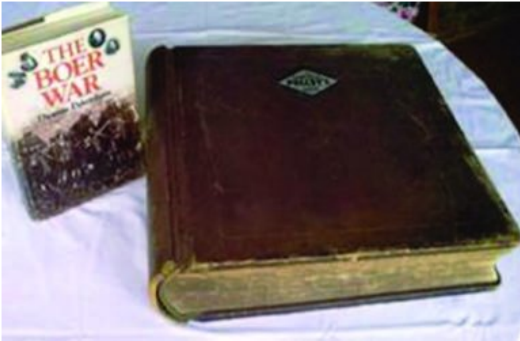
Die Transvaal Hotel se besoekersboek, wat meer as 14 000 handtekeninge bevat van mense wat Foto: F Pretorius, 2012