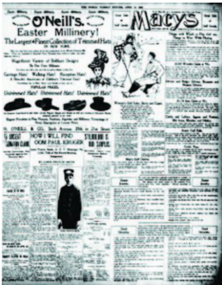
Die berig, 'How I will find Oom Paul Kruger' in 'The Evening World from New York', bladsy 9 op 10 April 1900

Amerika het baie simpatie met die Boere in Suid-Afrika gehad. 'n Philadelphia-koerant het die voor