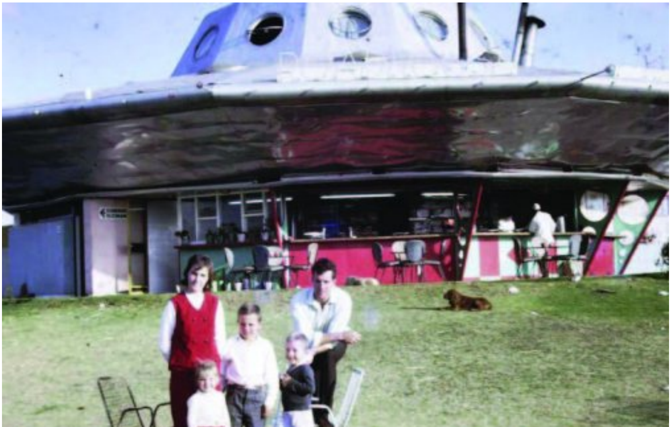
'n Rare kleurfoto van 'n gesinnetjie wat die padkafee destyds besoek het