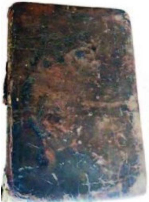
Die Oude Geboortebok van die familie Schoemans, wat hulle gebruik het tydens die Groot Trek en die Oorlog van 1812-1815.