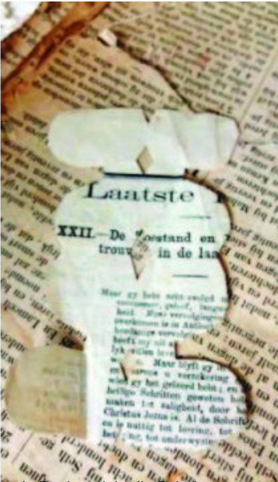
Die Prinses van die Babel Schoemans se familiebybel met ritse opesylke en versierde skrifte