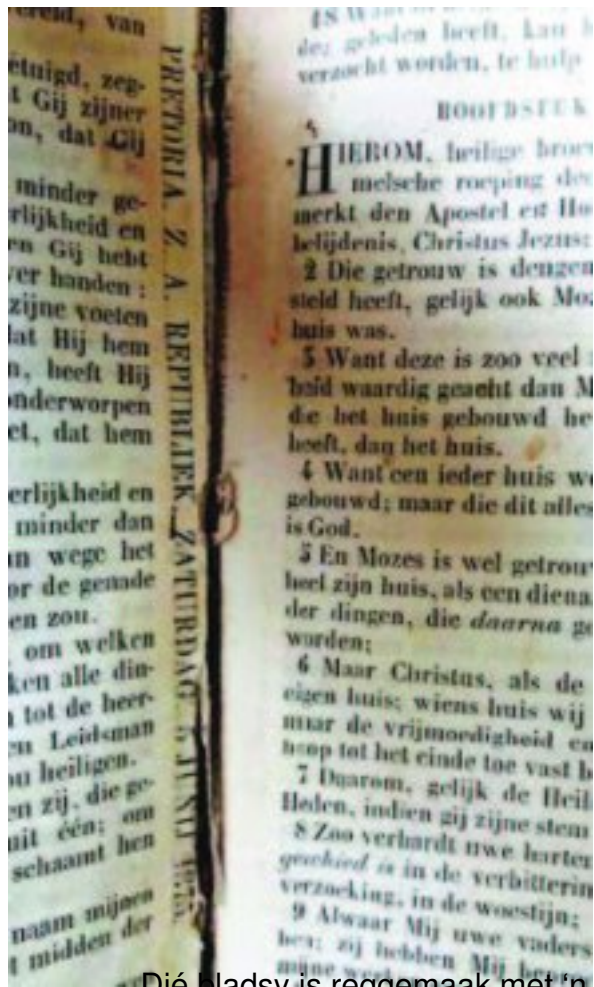
Dié bladsy is reggemaak met 'n koerant wat sê: Pretoria, ZA Republiek, Zaterdag 5 Junie 1875