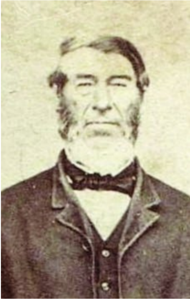
Andries Hendrik Potgieter