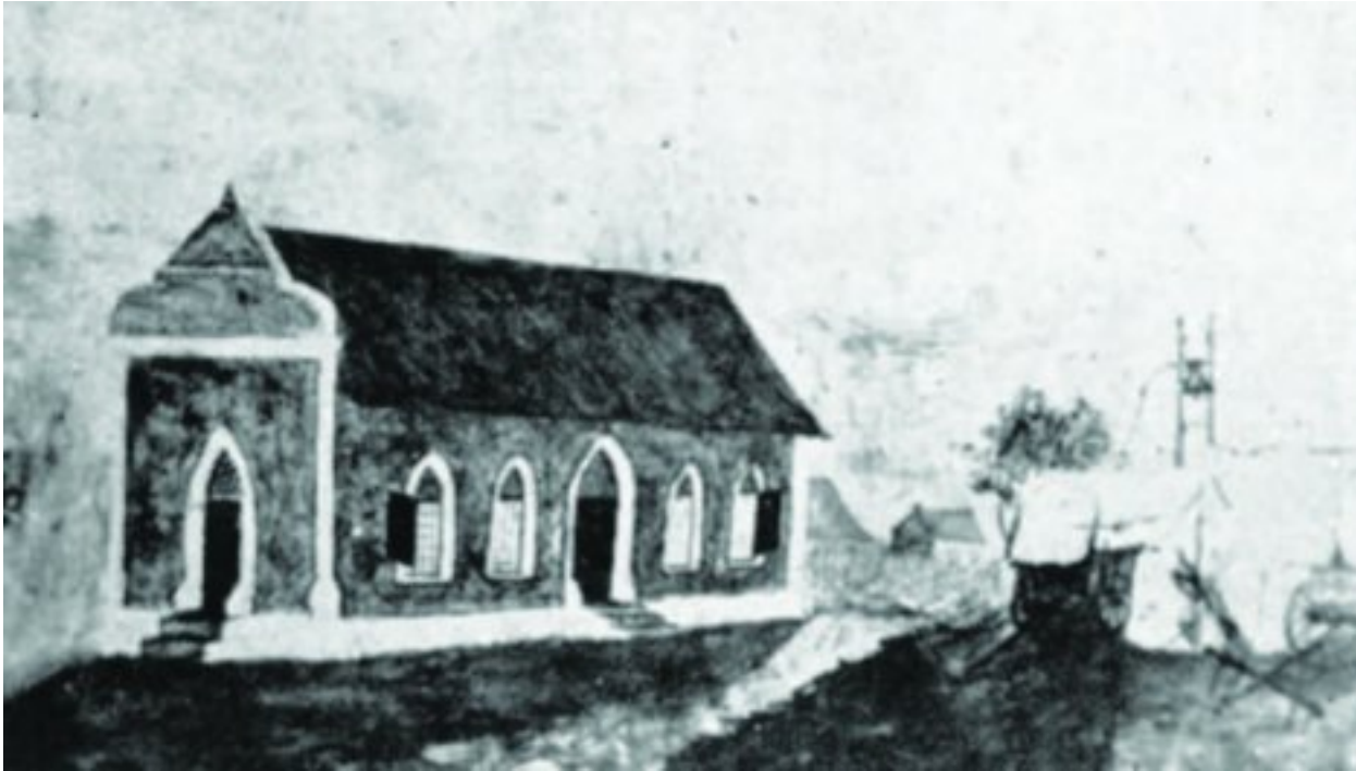
Die kerkie op Schoemansdal is in 1858 gebou, maar is in 1867 saam met die hele dorp afgebrand.

“Sy was ’n haastige vrou van geaardheid en ’n uithaler plannemaker. Sy besit ’n vaste, deurdrywende w