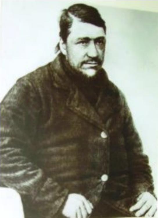
Dié foto van Paul Kruger is in 1864 geneem en hang in Krugerhuis