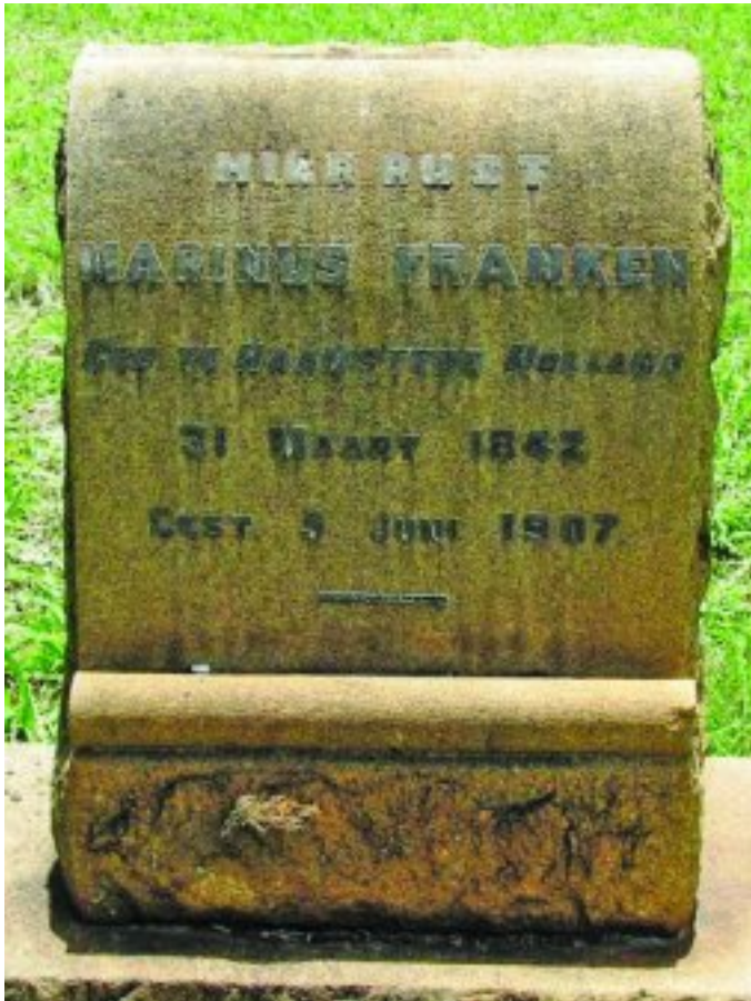
Marinus Franken se graf in die Kerkstraatse Begraafplaas