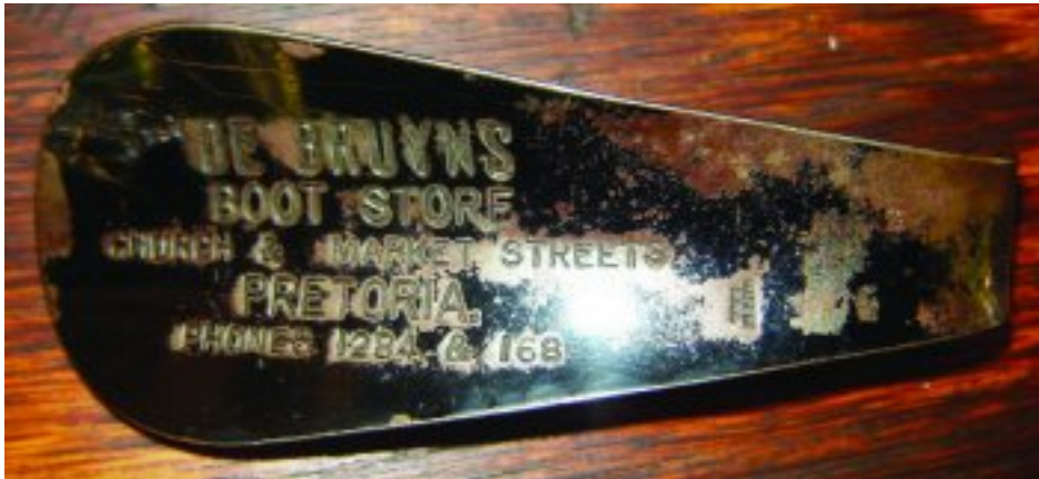
'n Skoenhoring van 'De Bruyns Boot Store' op die hoek van Kerk- en Markstraat, Pretoria