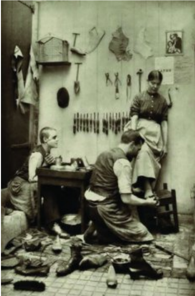
'n Skoemaker se werkswinkel in die laat 1800's