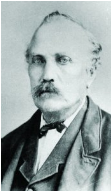
Die hoekerf het eers aan Marthinus Wessel Pretorius, eerste ZAR-president, behoort