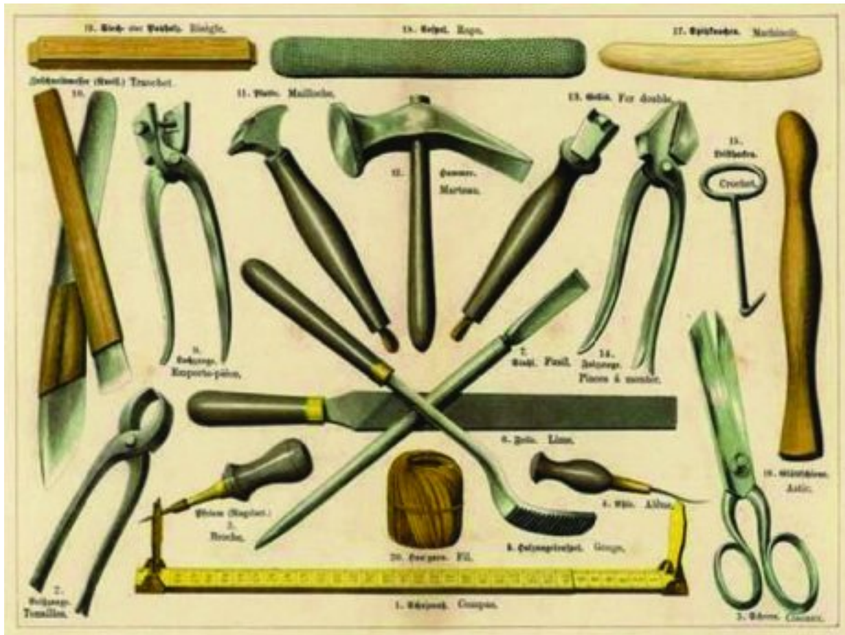
Gereedschap wat skoemakers in die 1800's gebruik het