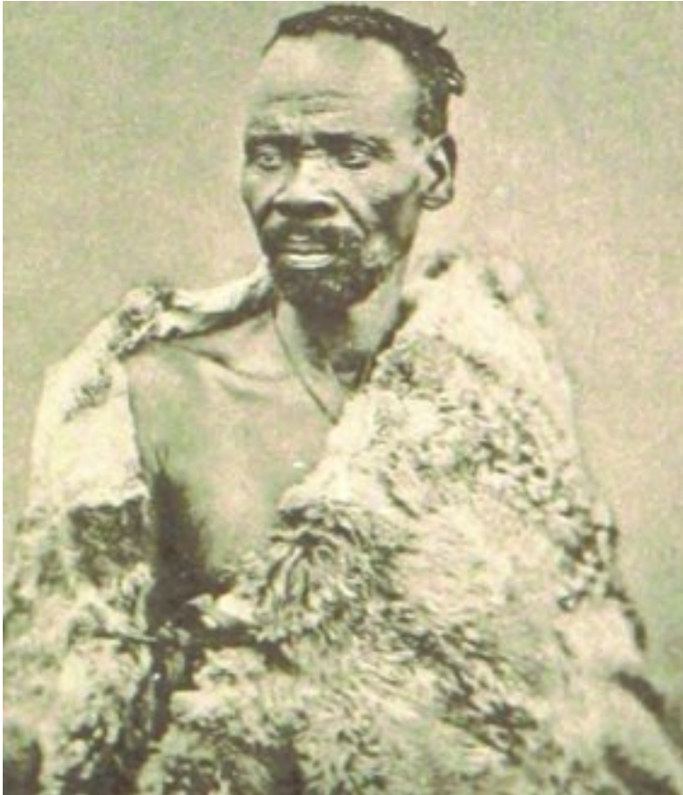
Klaas was in 1876 tweede in bevel onder MW Pretorius in die veldtog teen die Bapedihoof, Sekhukhune.