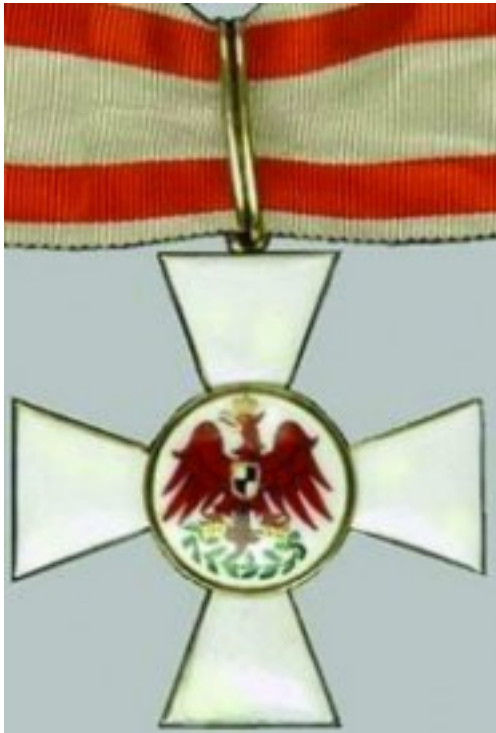
Ridder van die Rooi Arend – Pruise