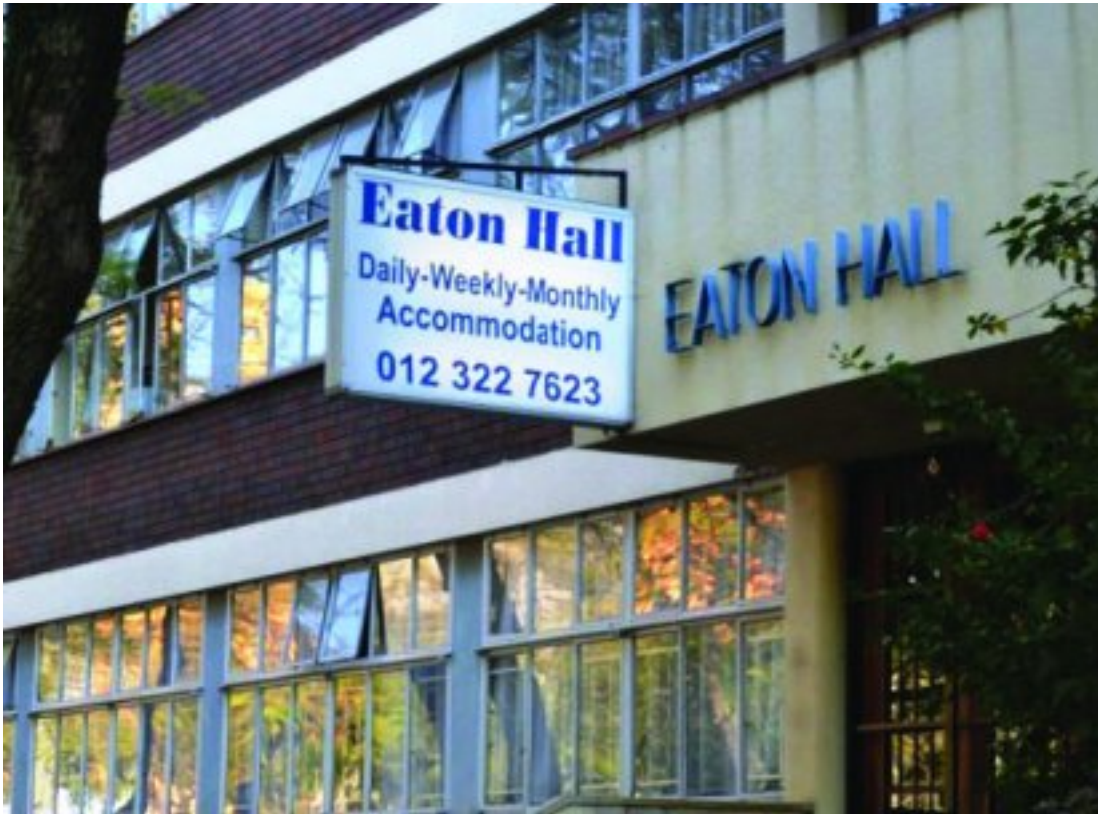
Eaton Hall, 'n residensiële hotel in Visagiestraat 266

Toe Klaas in 1887 as vise-president van die ZAR gekies is, het hy en sy gesin Pretoria toe getrek.