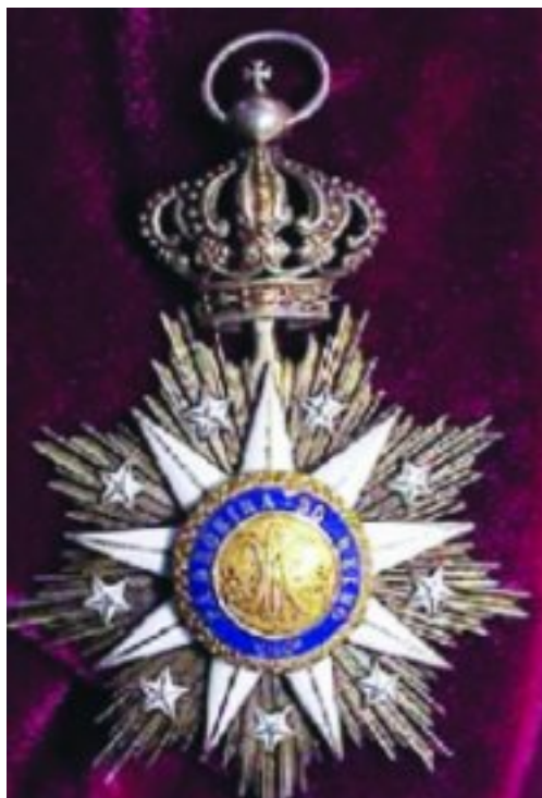
Kommandeur van die Orde van die Onbevleete Ontvangenis