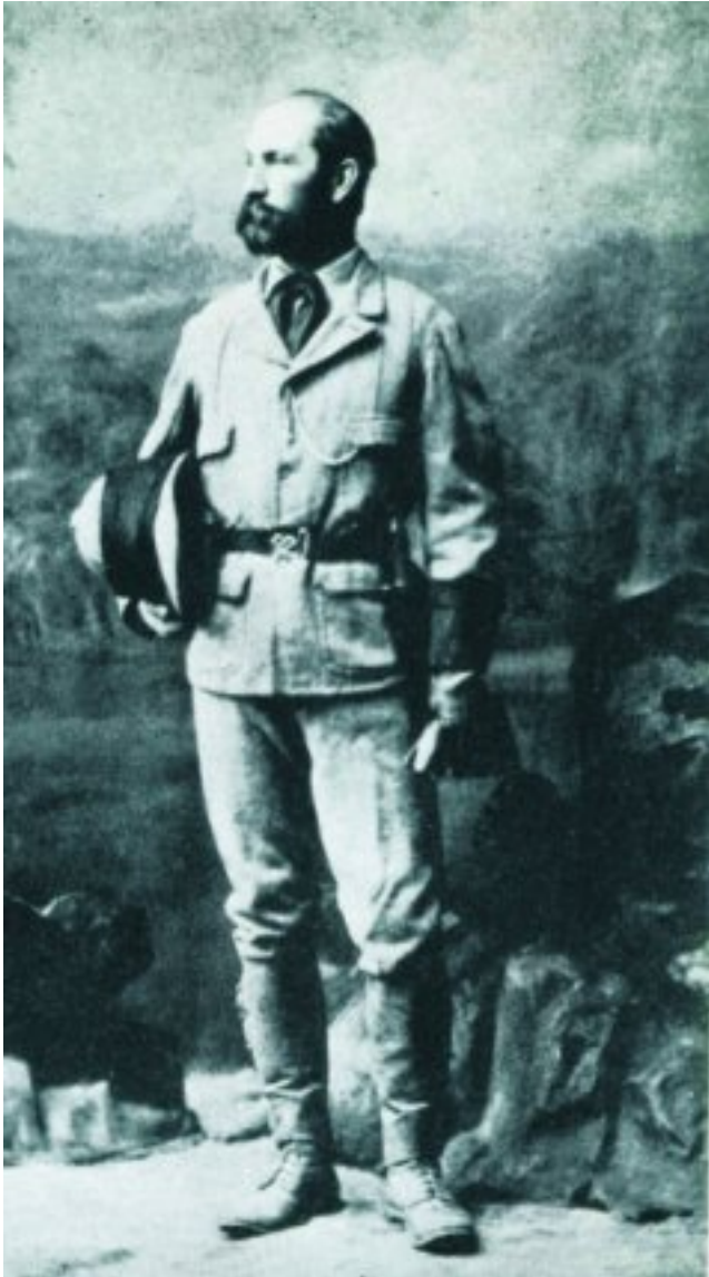
Generaal-majoor George Pomeroy Colley is op 27 Februarie 1881 dood in die Slag van Majuba

Geskiedskrywers berig dat daar groot verwarring was en dat die Britte na die suidekant van die be