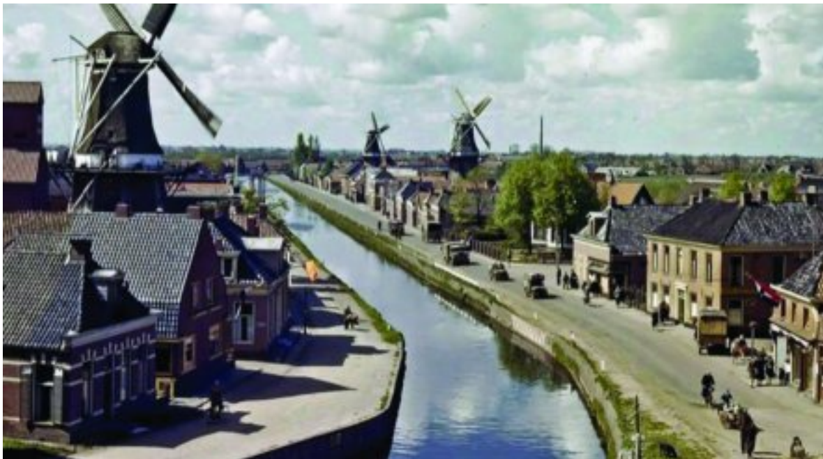
Winschoten in die provinsie Groningen in Nederland, waar die Bantjes-stamvader vandaan gekom