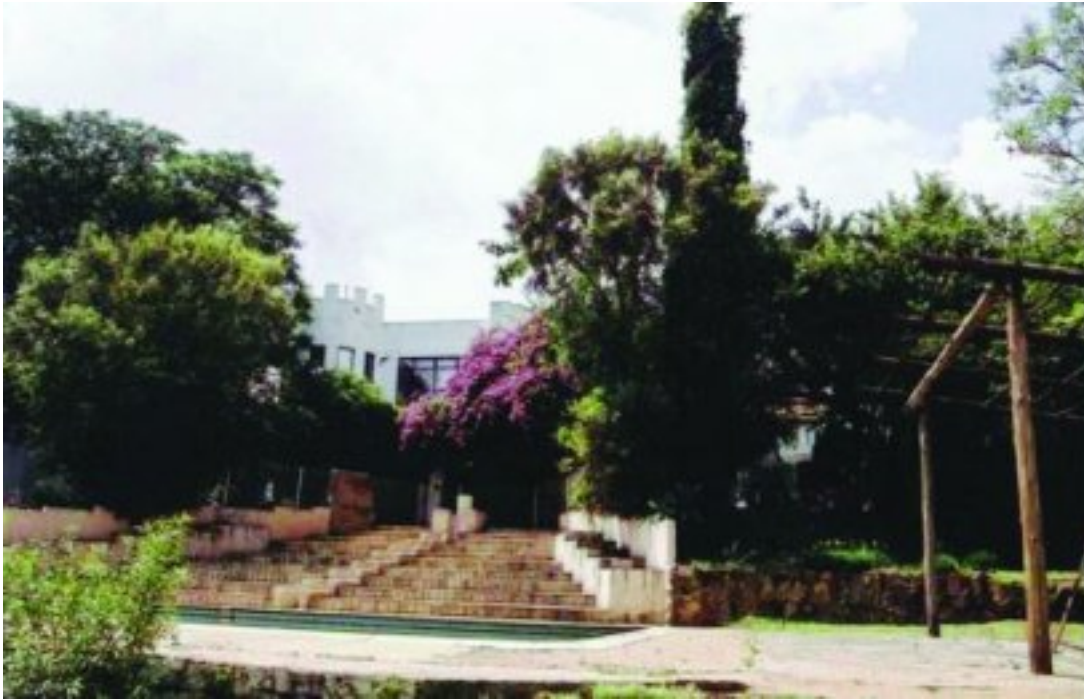
Die Schoeman-huis op Meerhof in 2003. Die huis is in 2005 gesloop

Hendrik is net daar deur kommandant PF Coetsee gearresteer omdat hy geweier het om as gewoone