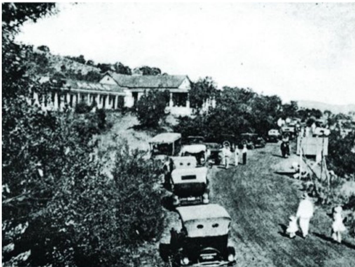
Johan Schoeman se kafee, waar toeriste by Hartbeespoorddam verversings geniet het. Die gebou is v