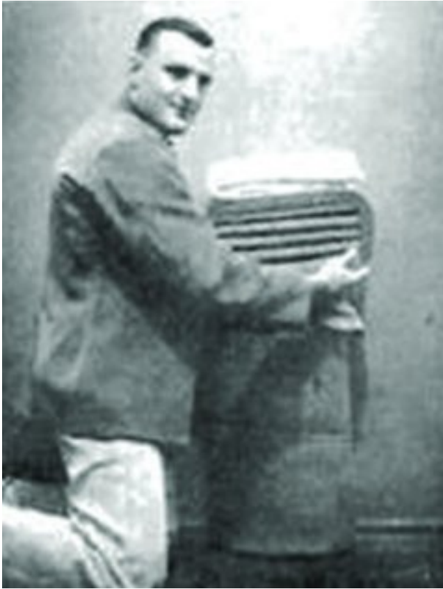
Die 'ritus' van komberse opvou