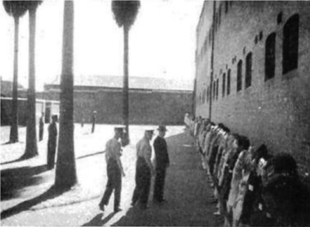
Inspeksie op die binneterrein van die Sentrale Gevangenis