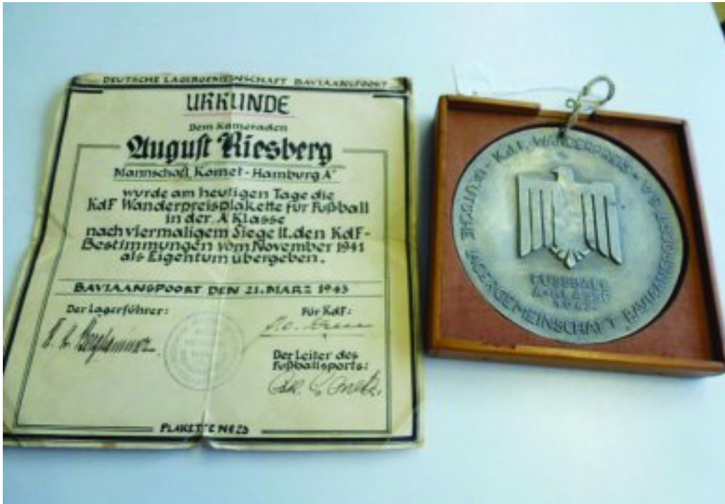
'n KDF Sokker-uitdaging medalje en sertifikaat van 1942 uit die Duitse interneringskamp, Baviaanspoort

Ringtennis het 12 ligaspanne opgelewer en jukskei het met agt spanne aan 'n kant gespog.