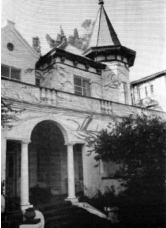
Mea Vota 'n aantal dekades gelede

Dié vereniging is op 10 Augustus 1976 gestig met die gedagte om 'n gedeelte van die huis as mus