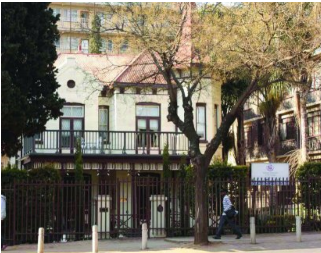
Mea Vota van die straat af gesien, omring deur Sunnyside se woonstelle

Sedert 1898 was dit 'n woonhuis, 'n koshuis, kantore, 'n museum, kulturele bestemming en deesdae