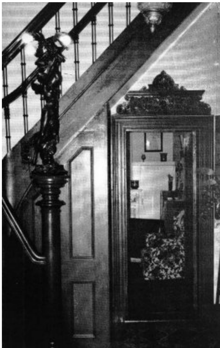
Binne in die huis