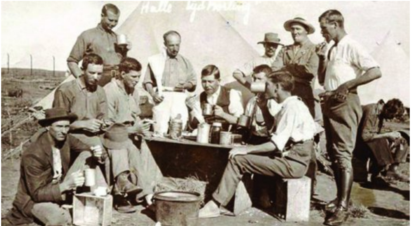
'n Aantal gevange 1914 rebelle in 'n Booyens kamptronk