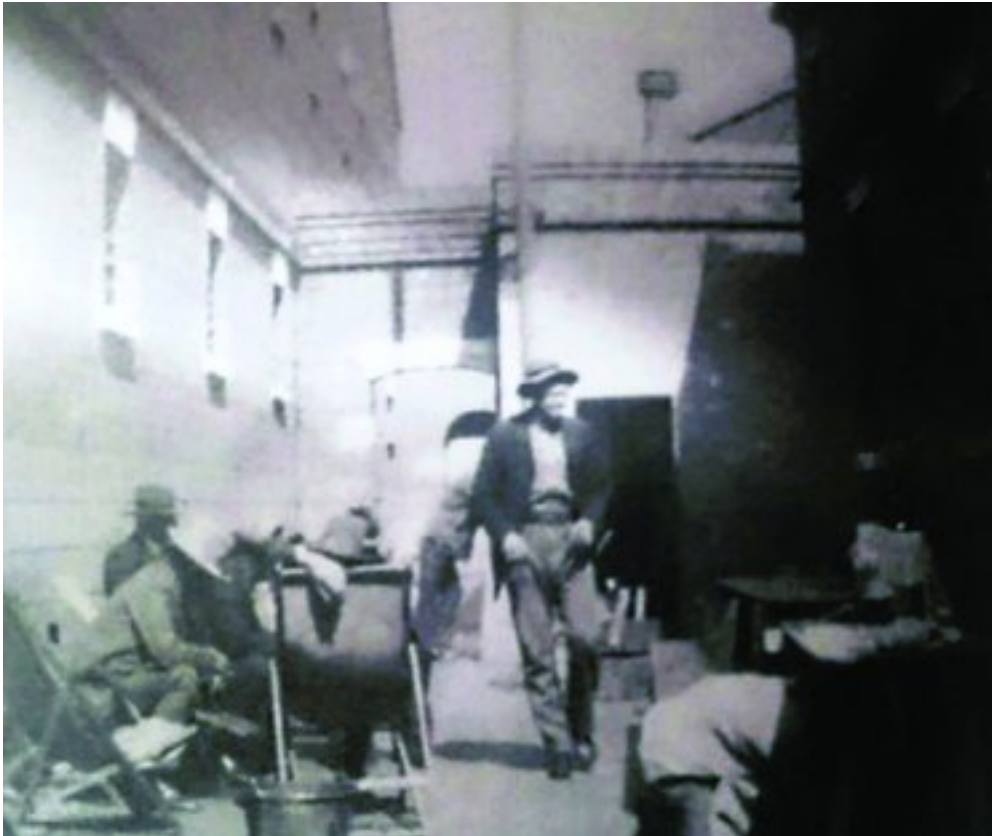
Rebelliegevangenes in 1915 in die Fort, Johannesburg

Tog was almal daarvan oortuig dat geen bloedvergieting sou plaasvind nie.