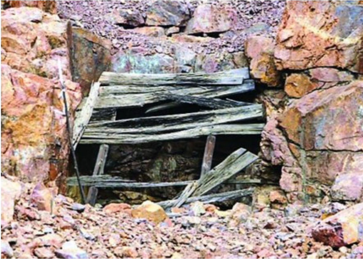
Die ou Albert-silwermyn se nommer twee skag