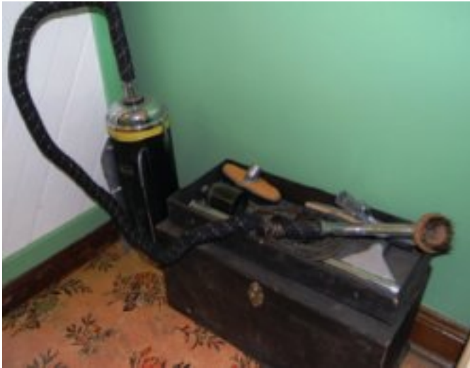
Die 1936 stofsuiër

Die McHardy's het die huis 81 jaar lank bewoon en die museum spog vandag met die gesin se oorspronklike meubels, ornamente, kombuisware en foto's.