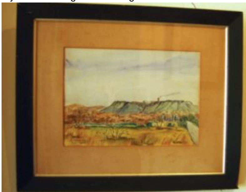
Die waterverf skildery van die Cullinan myn hang in die portaal en is gevef deur Donald McHardy wat s