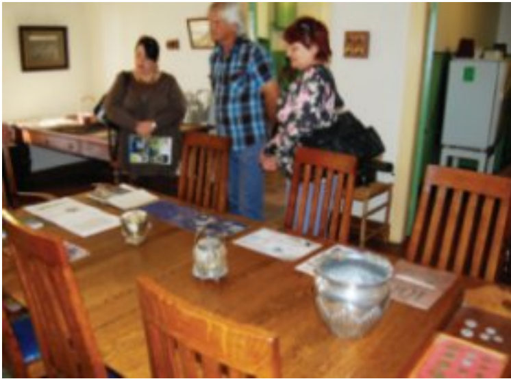
Die Europese eikehouttafel in die ontbytkamer is van handgekerfde hout met 'n besondere fyn g