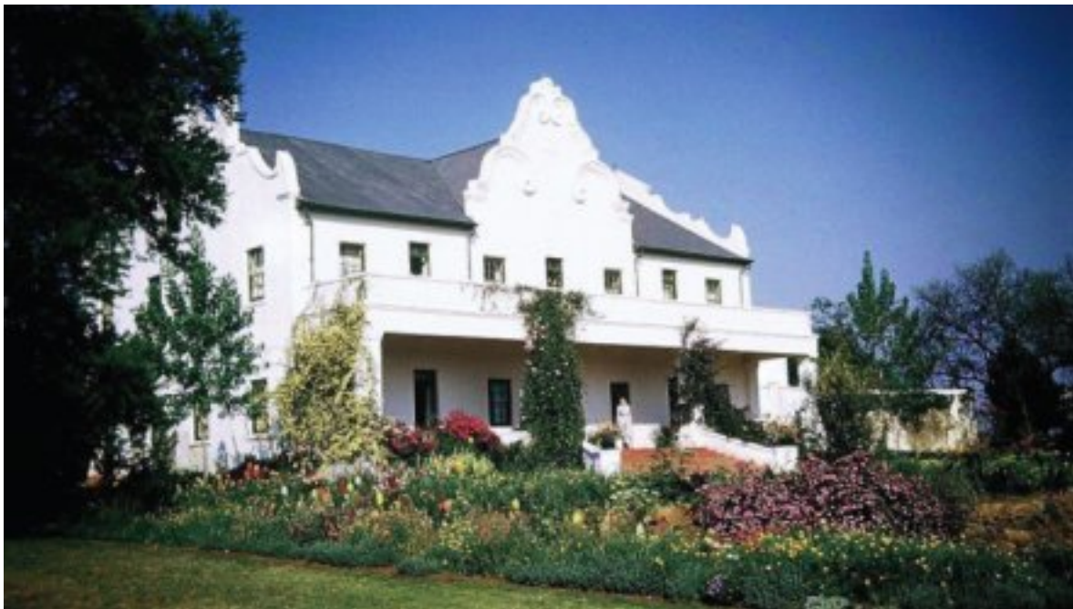
Die huis se pragtige tuine in 1960