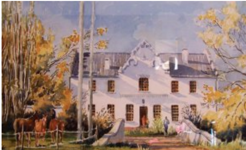
'n Olieverfskildery van die ingang na die huis

Die deel waar die historiese ou opstal en 1945 se gewelhuis en skuur is, gaan uitgehou word om 'n bestemming te skep. Frederick wil die ou skuur en Kaaps-Hollandse gewelhuis in 'n plek ontwikkel waar troues en konferensies gehou word. Hy het opwindende lang-termyn planne vir boeremarkte, vlooiemarkte, fietsroetes en wandelroetes op dié historiese ou plaas.