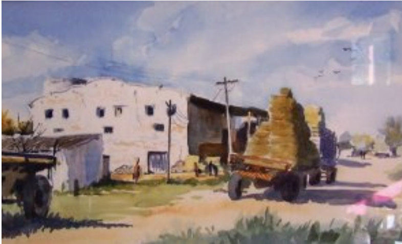
'n Olieverf skildery van die skuur in vergange jare