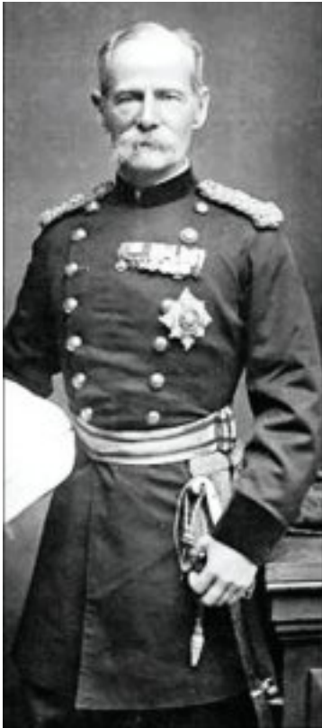
Die Britse veldmaarskalk lord Frederick Sleigh Roberts