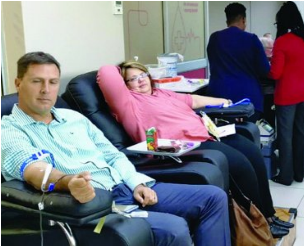
Gemeenskapslede skenk bloed vir Steyn

Hy is op 30 Mei per ambulans oorgeplaas na 'n reabilitasiesentrum waar hy geëvalueer is en sy d