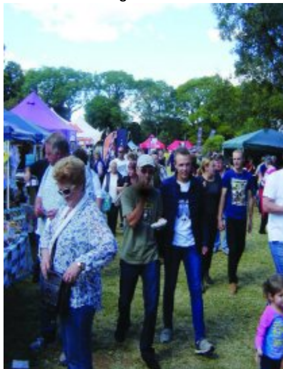
Die fees is deur 'n groot aantal besoekers ondersteun