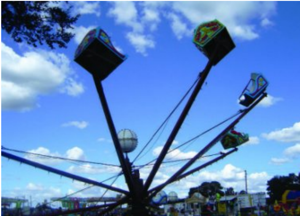
Groot en klein het by die pretpark in die lug rondgetol