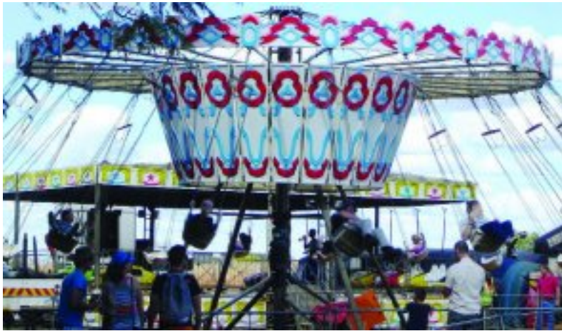
Selvs grootmense het die kans gebruik om te swaai